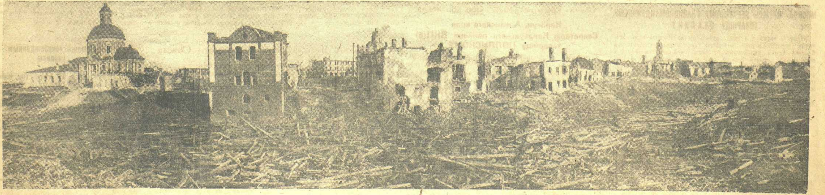
Город Вязьма 12 марта 1943 года.

Ценный итальянский капитан довольно точно воспроизвел картину разгрома итальянской армии. Фактически все итальянские дивизии, находившиеся на советско-немецком фронте, уничтожены или разгромлены. Десятки тысяч итальянских солдат и офицеров убиты, десятки тысяч захвачены в плен. В советском плену находится командиры итальянских дивизий генералы Паскалли, Регани и Баттисти вместе со своими штабами. 2 итальянская горнстрелковая дивизия потеряла убитыми и пленными 10 тысяч человек, 3 горнстрелковая дивизия — 10.700 человек, 4 горнстрелковая дивизия — 13.200 человек. Другие дивизии также разгромлены и прекратили своё бесславное существование. Таким образом от 8 итальянской армии остались, как говорят, «ежомки да ножки». К кому же в таком случае обращается и кого прославляет Муссолини в своём приказе? К 8 итальянской армии? Но этой армии уже больше не существует. От неё уехали лишь жалкие остатки, бежавшие с поля боя. По римскому обычаю о покойниках не говорят ничего худого. Муссолини, очевидно, верен этому обычаю. Было бы, однако, лучше, если Муссолини сказал, сколько солдат и офицеров 8 итальянской армии вернулась обратно в Россию.